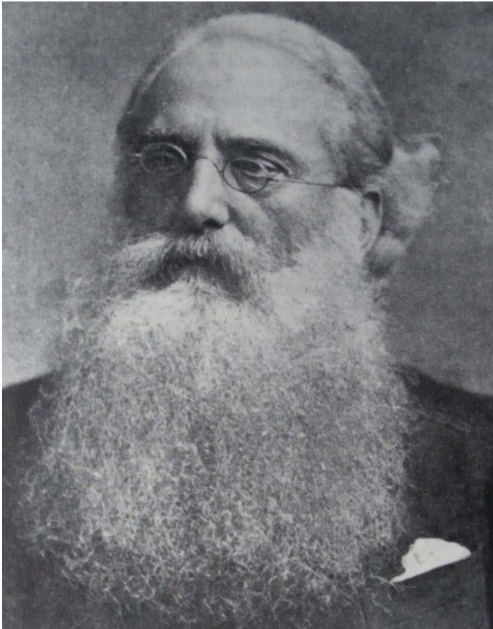
Полковник Генри Стил Олькотт, Президент Теософического Общества с 1875 по 1907 годы