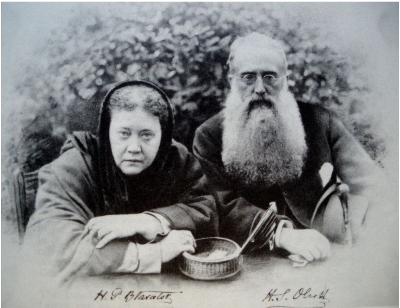
Елена Петровна Блаватская (12 августа 1831 - 8 мая 1891), полковник Генри Стил Олькотт (2 августа 1832 — 17 февраля 1907)