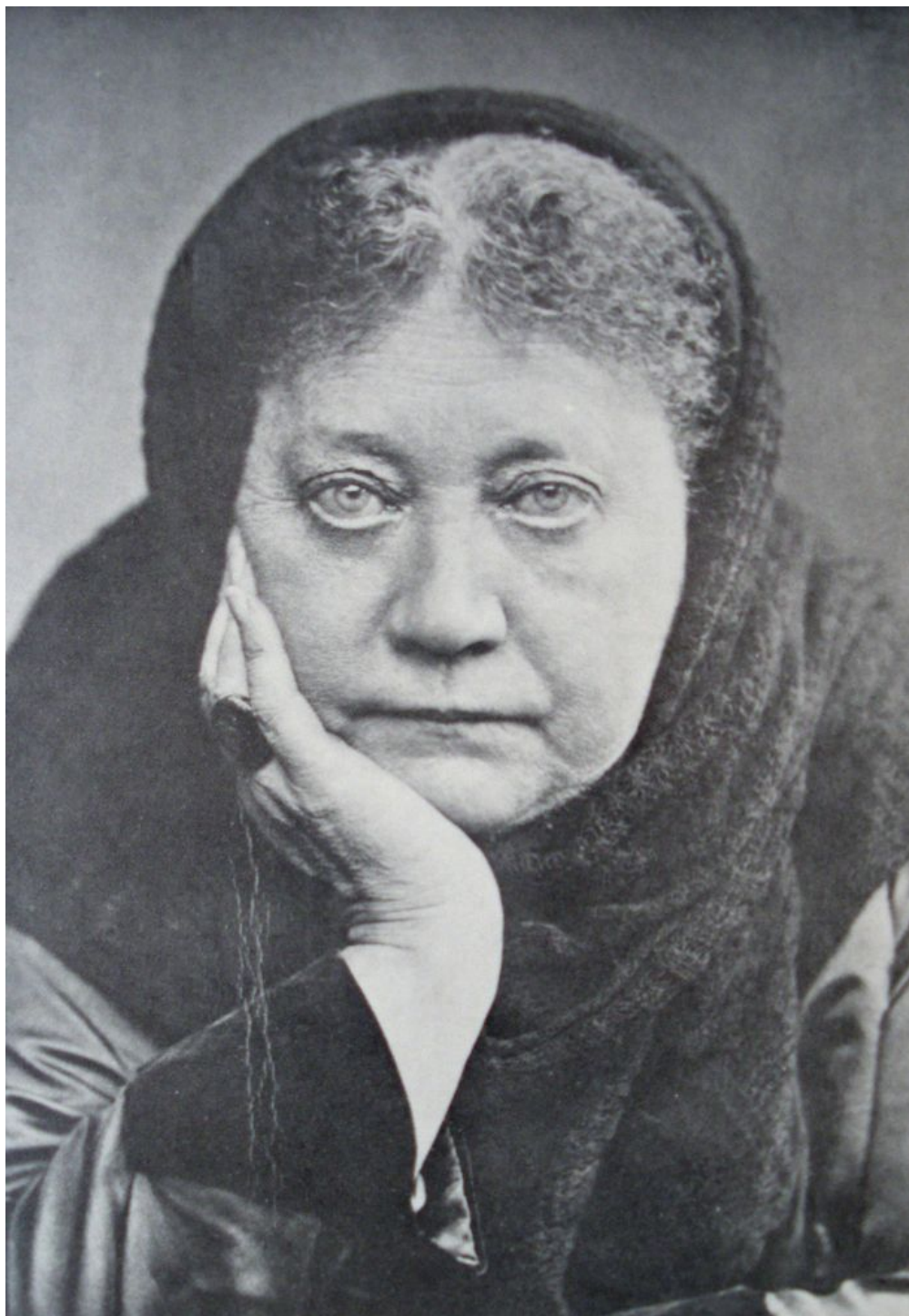
Елена Петровна Блаватская (12 августа 1831 - 8 мая 1891)