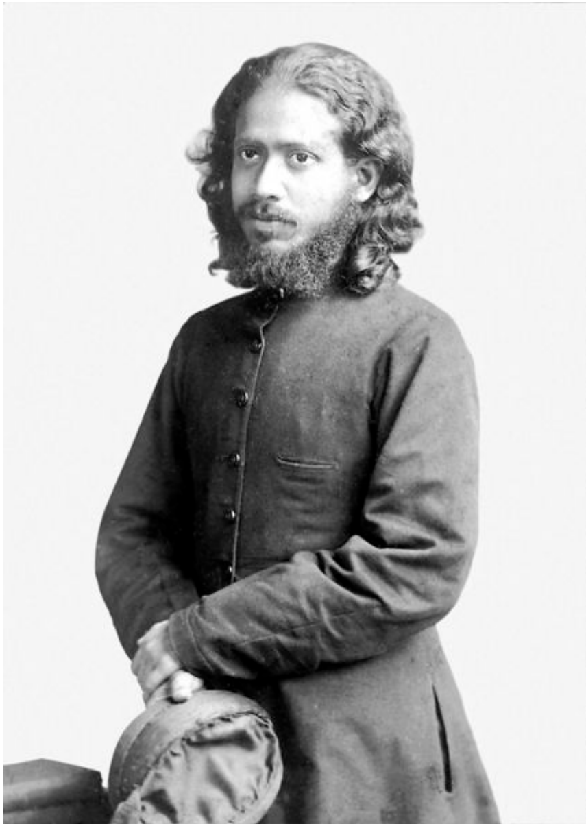
Мохини Мохун Чаттерджи (1858–1936)