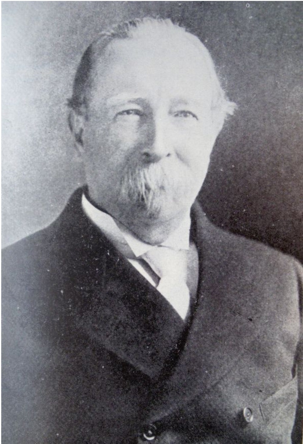
Аллан Октавиан Хьюм (6 июня 1829 - 31 июля 1912)