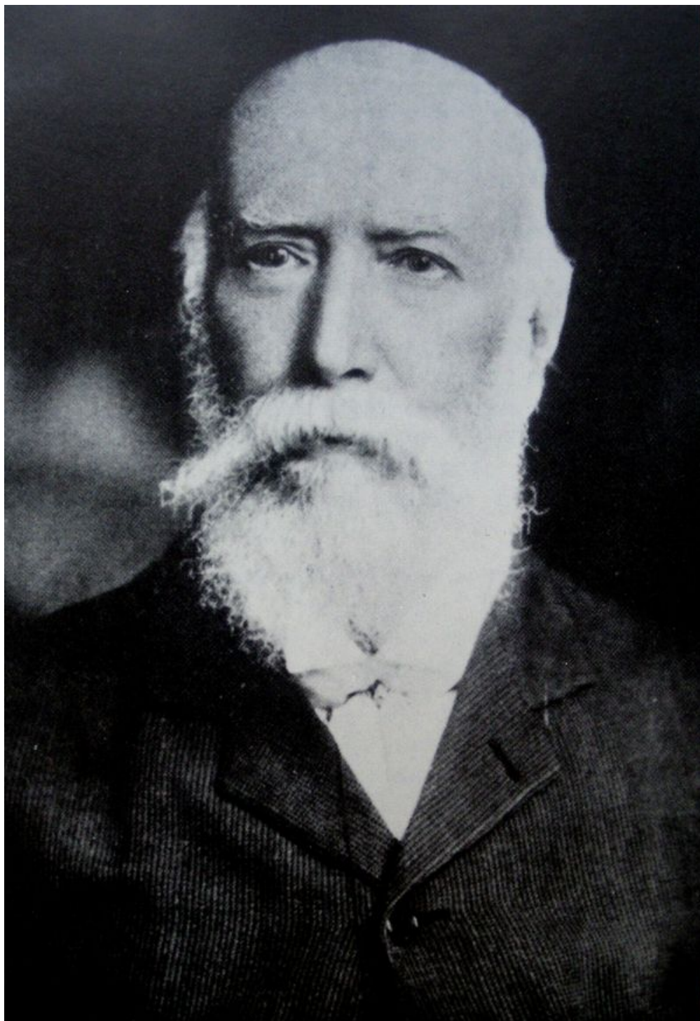
Альфред Перси Синнетт (18 января 1840 — 26 июня 1921)